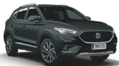
Čierna - Pebble Black* (metalický lak)

*Metalické a trojvrstvé farby sú za príplatok vo výške 600 EUR s DPH