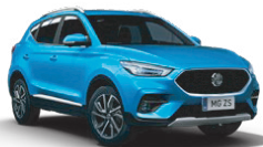
Modrá - Como Blue* (metalický lak)