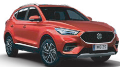
Červená - Diamond Red* (metalický lak)