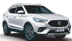
Bielá - Dover White