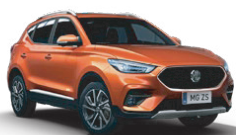
Oranžová - Hoxton Orange* (metalický lak)