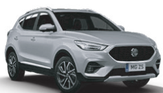
Strieborná - Cosmic Silver* (metalický lak)